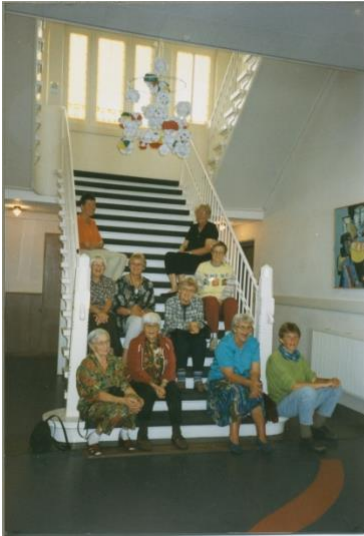
1997 - Zeehuis