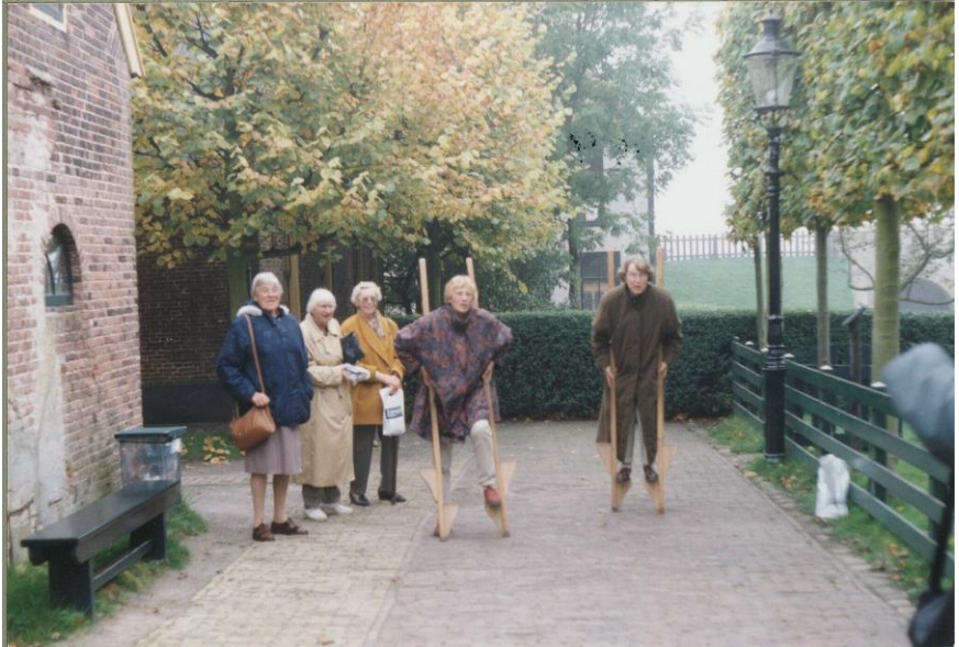
1994 - Kunnen we het nog?