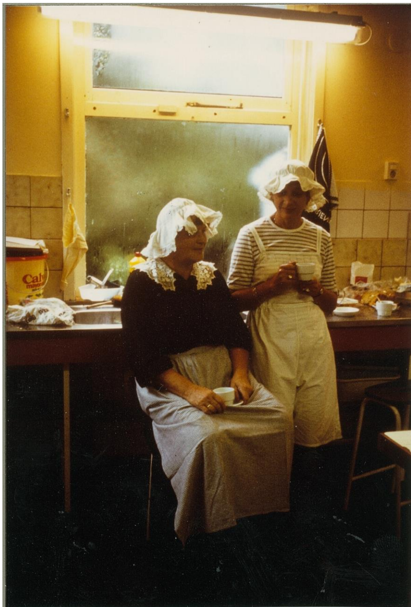
1983 – Hoek van Holland