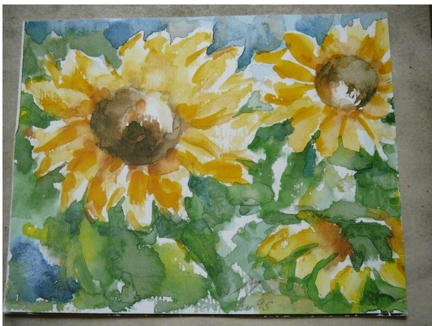
aquarel Mimi Kop

De deelnemers kwamen bijna allemaal uit Amsterdam. Toen er in de Toorts (het landelijke ledenblad van het Nivon) werd gepubliceerd kwamen er ook deelnemers van buiten Amsterdam. Het mannenbezoek midden in de week werd al snel afgeschaft. Zowel binnen het IvAO, als binnen het latere Nivon waren het over het algemeen mannen die het beleid bepaalden.