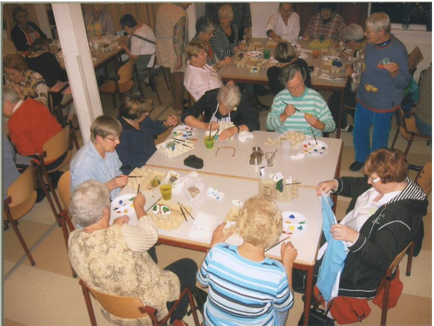
2007 - Hunehuis