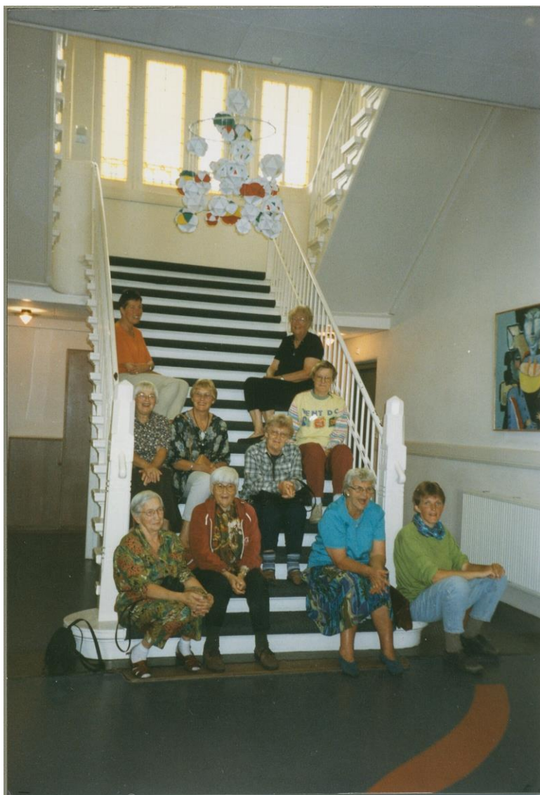
1997 - Zeehuis